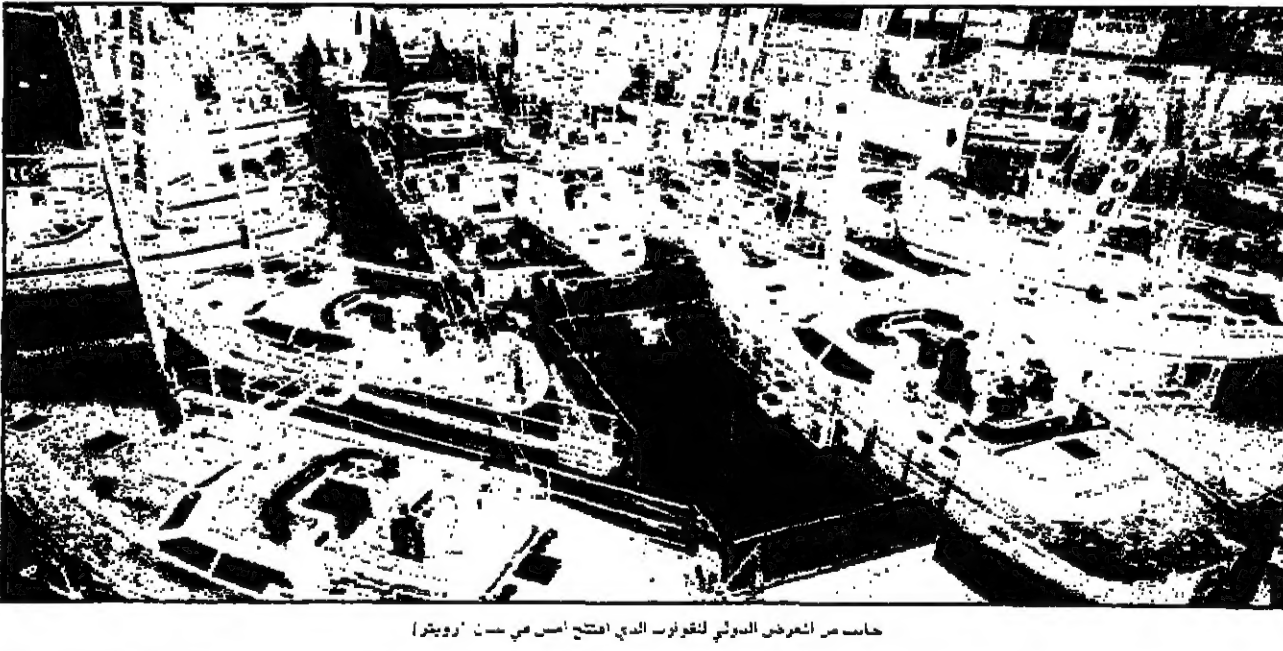
حاسب من المصنع الدولي لتقارب الذي اصنعت اسن في دبي

بيلاون - رويترز: قالت شركة كوتوموت ايطالية وهي الفرع الهندي لشركة كوتوموت انها فازت بطلبات تبلغ قيمتها الاجمالية 600 مليون ليرة ايطالية لبناء محطات صناعية في السعودية وتشييدها. وقالت الشركة انها ستورد صمغاً للاسفلت لشركة سافكو السعودية للاسفلت في إطار صفقة تبلغ قيمتها 300 مليون دولار وسحاق المسحوق بطاقة انتاجية سنوية تبلغ 500 ألف طن من البولي يوريثان في مدينة الجبيل المطلة على الخليج.